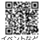
イベントなど中止のお知らせ

防災ラジオ導入に伴い、有漢・川上地域の防災行政無線を3月31日(火)で廃止します。