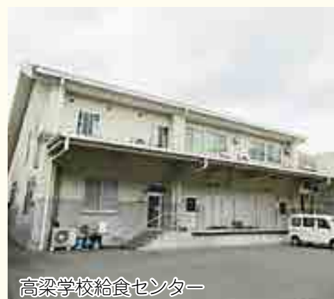
高梁学校給食センター

給食は、友達とゆっくり話ができ、落ち着くことができる大切な時間です。もうすぐ中学校を卒業するので、大好きな「ビビンバ」や「プリン」を食べることができなくなるのは寂しいですが、これからも後輩たちのためにおいしい給食を作ってほしいと思います。