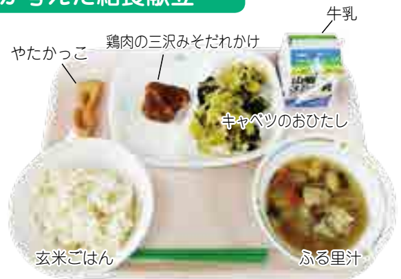
川上小学校6年生が考えた令和元年度の献立 川上町の特産品と旬の野菜を使用した「われら川上町！」

家庭科の学習で得た知識を生かすとともに、地域の食材を活用した献立を作成できるよう、栄養教諭・栄養職員や各学校の先生がアドバイスをを行っています。