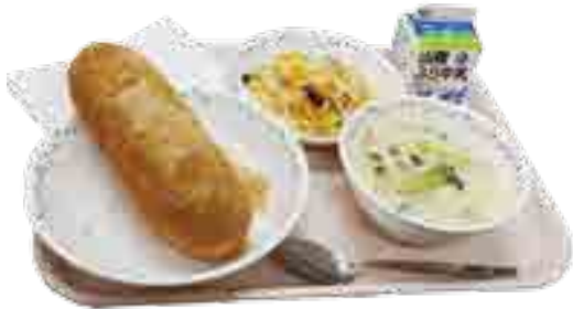
有漢・川上学校給食センターで人気の「揚げパン」