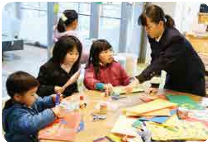
子どもたちと一緒に工作を

市内の中学生12人が高梁市図書館や吉備国際大学の学生と共に企画した「本の世界へさあいこう!～お気に入りの1冊を見つけよう～」(市教育委員会主催)を開催しました。当日は、中学生による本の読み聞かせや工作(折り紙、ブックカバー、しおりの作成)などが行われ、子どもたちは楽しみながら本と触れ合っていました。