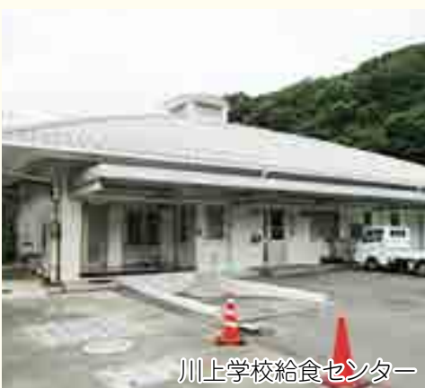
川上学校給食センター