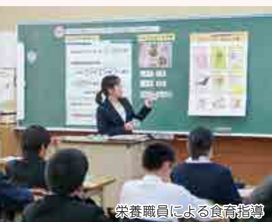
栄養職員による食育指導

アレルギーを引き起こす材料の除去などのために、調理員の調理工程が複雑にならないように心掛けています。また、特に夏場は、生ものや食中毒を引き起こしやすい食材を使わないなど、食材の選定には十分気を付けています。