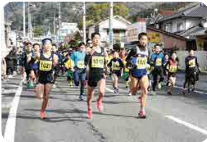
優勝を目指してスタートする選手

「がんばろう高梁!! 第41回市民健康づくり愛らぶ高梁ふれあいマラソン」(市・市教育委員会・市体育協会主催)が開催され、今回は3コース12部門に964人が参加。沿道の声援を受けながら、吉備国際大学シャルム岡山高梁の選手や岡山県マスコット・ももっちと一緒に城下町の趣が色濃く残る町並みを駆け抜けました。