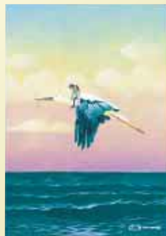
「春愁の影うねらせて海蒼く」 『詩とメルヘン』2003年4月号表紙原画

今回、成羽町美術館では、やなせたかしさんの創作活動を約200点の絵画や絵本原画、自作詩などをご紹介します。ご家族や友だちと一緒に「やなせワールド」に足を踏み入れてみませんか？ 元気100万倍です！