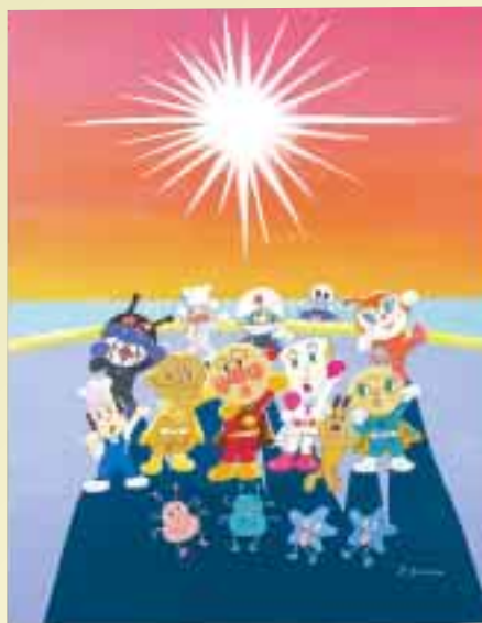
「てのひらを太陽に」