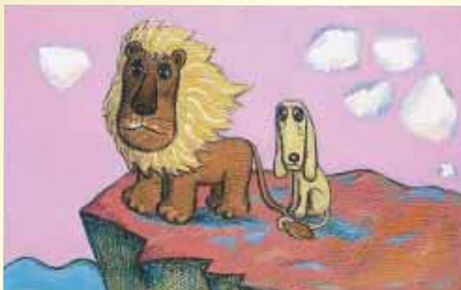
フレーベル館「やさしいライオン」