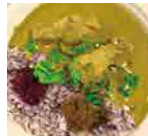
備中うるし薬膳カレー

未熟な私がかここまでやってこれたのは、お世話になった地域の方々の優しさのおかげです。3年間、本当にありがとうございました。