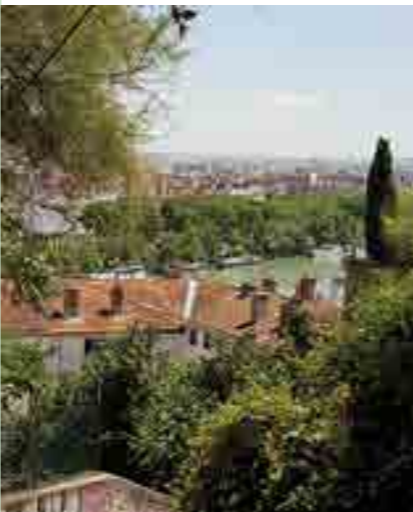
高台から眺めるリヨン市

知るふふれは「高梁を知る」と「シルプレ」(フランス語で「よろしければ」)を掛け合わせた言葉です。