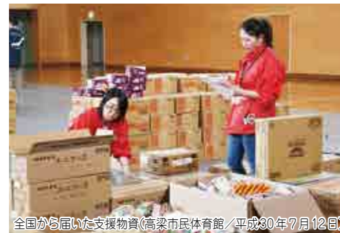
全国から届いた支援物資(高梁市民体育館/平成30年7月12日)