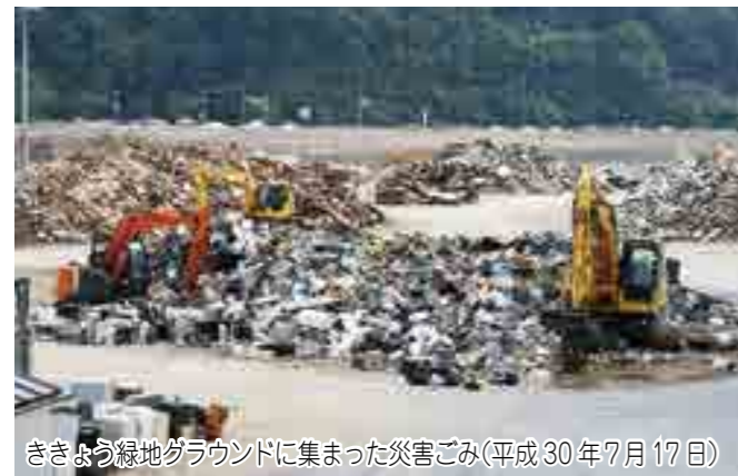
ききょう緑地グラウンドに集まった災害ごみ(平成30年7月17日)