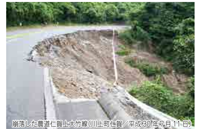
崩落した農道仁賀上大竹線(川上町仁賀/平成30年7月11日)