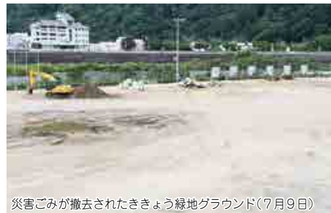
災害ごみが撤去されたききょう緑地グラウンド(7月9日)