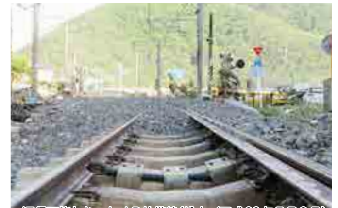
運行不能となったJR伯備線(松山/平成30年7月8日)