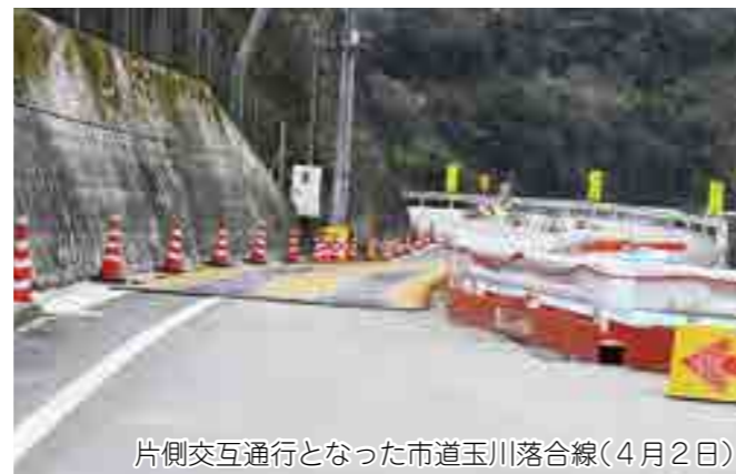
片側交互通行となった市道玉川落合線(4月2日)