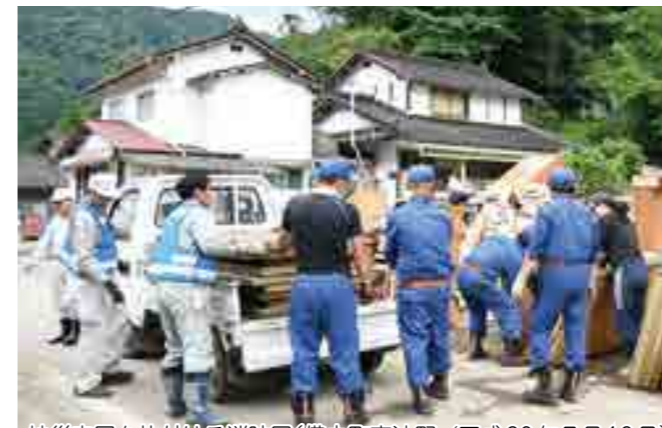
被災家屋を片付ける消防団(備中町東油野/平成30年7月12日)