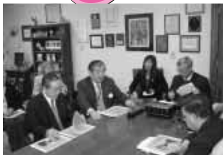
ビーミッシュ市長との会談（市長室）

識が強く、こうした社会精神がより安全で快適・きれいなまちをつくっているのだと深く印象に残りました。