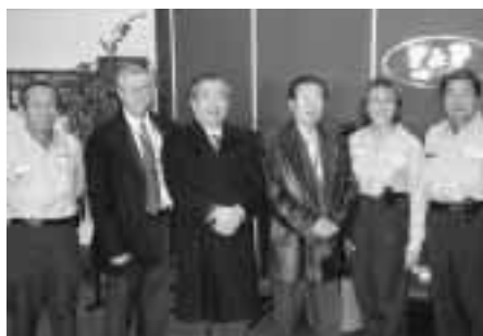
企業などを視察（日系企業のF&P）

併せて、平成22年には姉妹都市締結20周年を迎えることから、その記念事業として、2年後に高梁市民を募って「いちご祭り」のトロイ市を訪問したいと要請