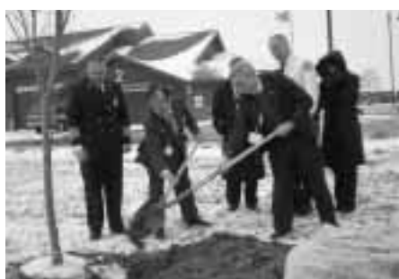
末永い友好を誓って記念植樹（消防署）