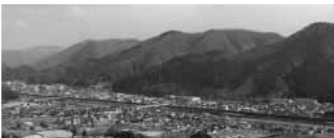
川向こうが「下原」の町。手前は「成羽」、右端の山が鶴首山で中央が愛宕山。中央の橋は総門橋。(写真左が成羽川下流)