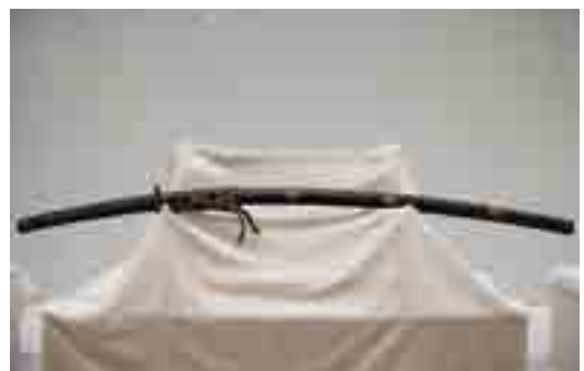
板倉勝静が佩用したと伝わる陣刀拵