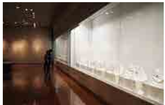
刀剣がずらりと並び