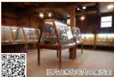
旧片山家住宅内の展示室