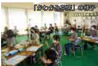
「かわかみ茶坊」の様子

中山間地域の高梁市では、自家用車などの移動手段がないことで「通いの場」へ行きたくても行くことができない人も多かったことから、かわかみ茶坊ではボランティアさんによる「通所付添サポート」活動が開始されました。移動手段がなかった住民の方も通いの場に参加できるようになり、住民同士が気軽に交流できる機会が広がったことで、相互に助け合う方々の関係性や絆が深くなると思いました。