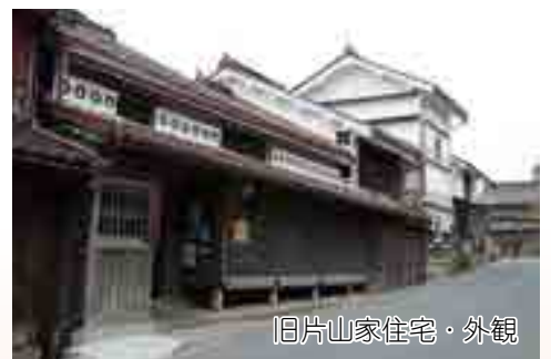
旧片山家住宅・外観

主屋は18世紀末頃に建立され、数度の増改築を経て現在の姿となりました。一階に弁柄格子、二階に海鼠壁と虫籠窓という伝統的な意匠が施され、吹屋の歴史的な町並み景観に欠かせない建築です。敷地内の土蔵には、弁柄の精製・梱包作業の様子や、同家に保管されていた資料が展示されています。