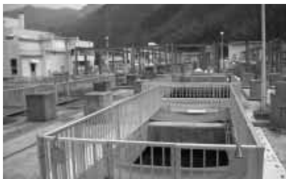
浄化センター（エアレーションタンク）

下水道事業は、独立採算制を原則としています。雨水処理に係る経費は公費負担(市の負担)ですが、汚水処理に係る経費は、本来、全額を使用料で賄わなければならぬとされています。現行の使用料は、急激な値上げを避け、使用者の皆さんの負担を軽減するため、平成9年4