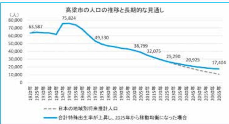
高梁市人口ビジョンより

市長 新しい総合計画では30人以上下学級や義務教育学校など、特色ある教育環境、医療・福祉の充実