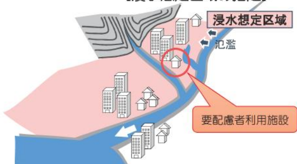
【浸水想定区域の指定】

※「洪水浸水想定区域」とは、河川が氾濫した場合に浸水が想定される区域であり、河川等管理者である国または都道府県が指定します。