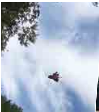
山中からのホイスト救出訓練