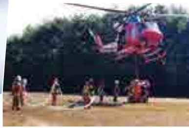
低空ホバリングをするヘリコプターへの給水訓練