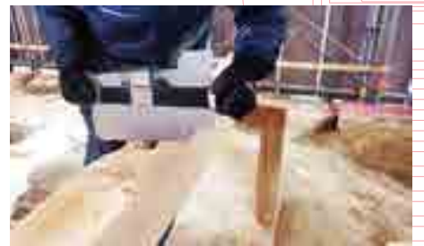
かたと型取りによる土台調整