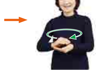
もち まる ようす 餅を丸める様子