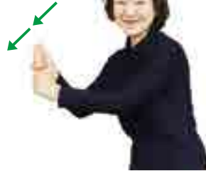
きね もち ようす 杵で餅をつく様子