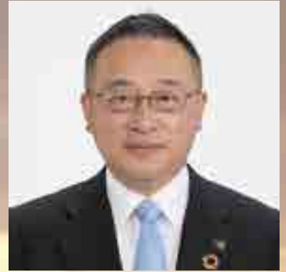
高梁市長 近藤隆則