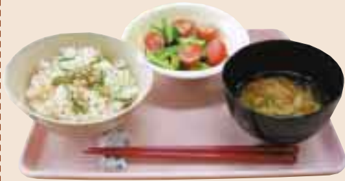
サケと青シソごはん、かきたま汁、サラダ

昨年度開催の「ぱっちりバッチリ!朝ごはんコンテスト」入賞作品(学年はコンテスト時)を紹介。このほかのレシピは、市ホームページに掲載しています。