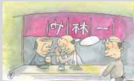
給付金拜んでにっこりコップ酒