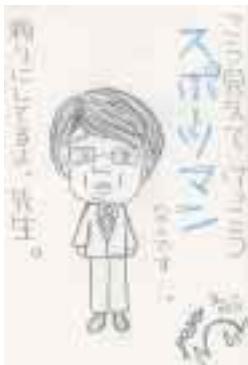
▶「私の担任1年A組」 ペンネーム 野球娘

松原の絶景を楽しみ、市場へも寄っていただけたらと思います。年末までの毎週日曜日、笑顔で皆さんをお迎えします。