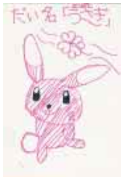
▶「よつばとうさぎ」 ペンネーム ミーヤン