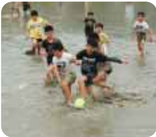
どろんこサッカーの様子

前の田んぼで行った、どろんこサッカーには、地元の子どもたちのほか、高梁野外スポーツ少年団の子どもたちが参加してくれました。最初は泥の感触に少し戸惑っていたようですが、サッカーが始まるとみんな必死でボールを追いかけていました。