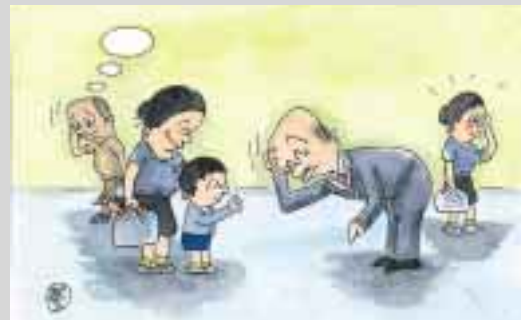
選挙が近いらしいぞ低い腰