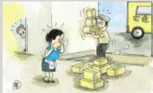
肩書きへどつと押し掛けお中元