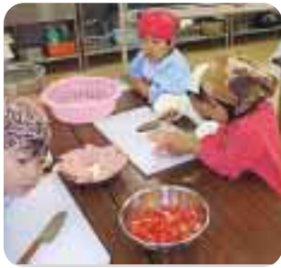
調理に挑戦する園児たち

ミニトマトやハムを包丁で切ったり、ラップでおにぎりを丸めたり、一生懸命の園児たち。最後にそれぞれのお弁当箱に詰めて、みんなでおいしくいただきました。自分で作ると、嫌いな食べ物もしっかり食べることができたようです。