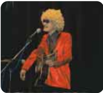
平川ふれあい文化祭にて

現在はソロ活動ですが、今後は気の合う仲間たちと音楽の輪を広げていこうと思っています。なお、これからも「郷土」「昭和」「青春」の3つの言葉をキーワードに、地域の皆さんに親しまれ、生きる勇氣や夢と希望を与えられるような歌を作っていきたいと思っています。