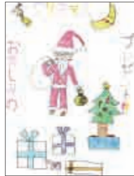
ペンネーム ミーヤン