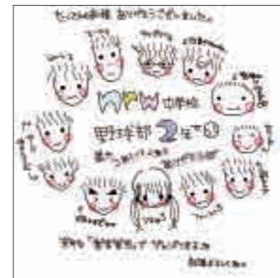
▲イラスト ペンネーム N中野球部マネージャー