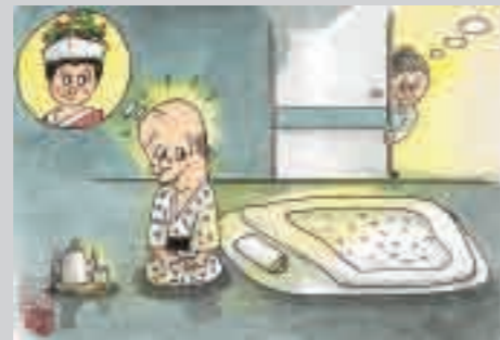
今宵又 続きの夢路床に入る

1月号は「児島虎次郎を偲ぶ絵画展」児島賞(金賞)受賞作品をご紹介します。寄せられたお便りや文芸作品は、2月号でご紹介させていただきます。