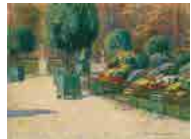
▲徳永仁臣《巴里 リュクサンブルグ公園》1912-13 年