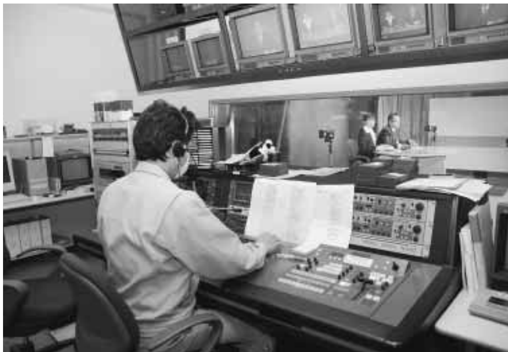
行政チャンネル「市政だより」収録の様様

ケーブルテレビが市内全域で放送されることに伴い、これまで市ホームページと吉備ケーブルテレビ29チャンネルで情報提供していた「行政チャンネル」は、市民の皆さんにより分かりやすい放送とするため、4月1日から内容を一新してお届けします。