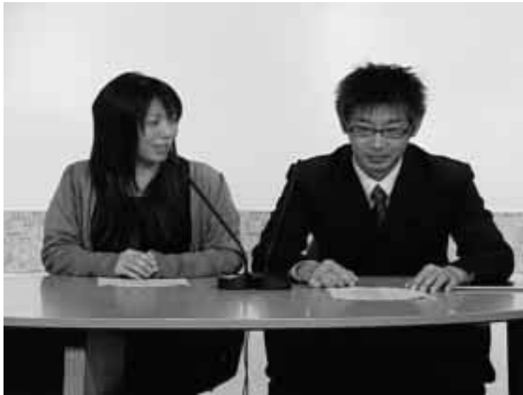
映像情報の映像イメージ…企画課から「広報たかはしのみどころ」について