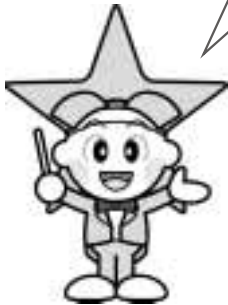
マスコットキャラクター 「ももっち」

今月号から、このコーナーで、高梁市の 取り組みを中心に紹介していくのでよろ しくね。