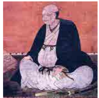
水谷勝隆像(市指定重要文化財・個人蔵)