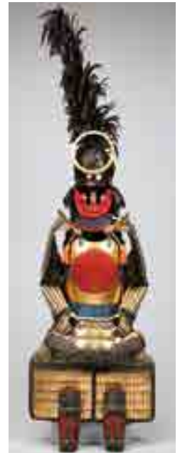
日の丸金箔押紬糸威二枚胴具足(岡山県指定重要文化財)