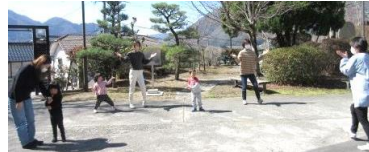
戸外で『探検ゲーム』をしました

令和4年度最後の「2歳のひろば」のトークタイムでは情報交換をしました。1年を通してできることが増え、みんな入園を心待ちにしています。