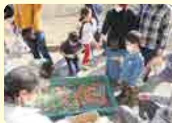
2022年 子どもお楽しみ会の様子