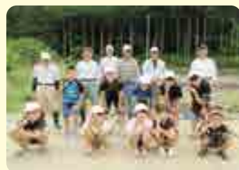
田植え体験の様子