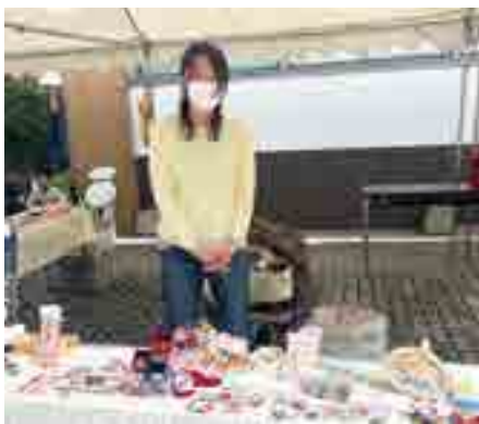
4月に行われた本町での雛まつり会場にて

まずは、市内の多くの方とつながりを持ちたいと思います。私を見かけたらお気軽にお声掛けください！