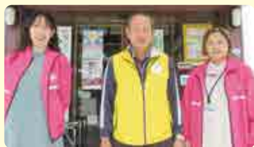
津川地域市民センター・公民館職員の皆さん

「つどう・まなぶ・むすぶ」地域コミュニティの拠点、公民館。さまざまな世代でつながり、語り合しましょう!