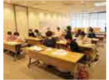
自分の悩み・看護観を共有