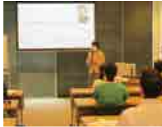
ストレスへの対処法を学ぶ

また、毎回グループワークでは他の医療機関で働く新人看護師仲間と意見の交換や悩みを共有し合うことで、1年間を通して自分の働き方や感じたことを内省し、自分の目指す看護観を再確認し合いました。