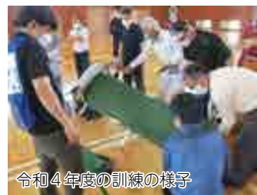
令和4年度の訓練の様子

6月11日(日)に、市内各地で「大規模水害対策訓練」を行います。当日は防災ラジオやメール配信サービスを活用した訓練を行いますので、ご理解とご協力をお願いします。