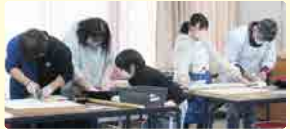
▲町民の皆さんによるそば打ち

松岡地区のそばは昔からの名物で、そば打ち技術の伝承のため、年末に年越しそばを自分で打って食べてもらう教室を開いています。何回か経験した小学生が上手にそばを打つ様子は、上達しない自分には感動ものです。自分が打った分は持ち帰るのですが、コロナ前は先生が打ったそばも試食することができてとても楽しみでした。今年は復活できることを期待しています。