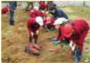
▲サツマイモの収穫

子どもたちに楽しい思い出をつくってもらい、松原を好きでいてほしいとの思いから、地域学校協働活動推進員を中心に、松原小学校と連携して「まちたんけん」や「正月飾りづくり」などいろいろな活動をしています。また、学校の畑にサツマイモの