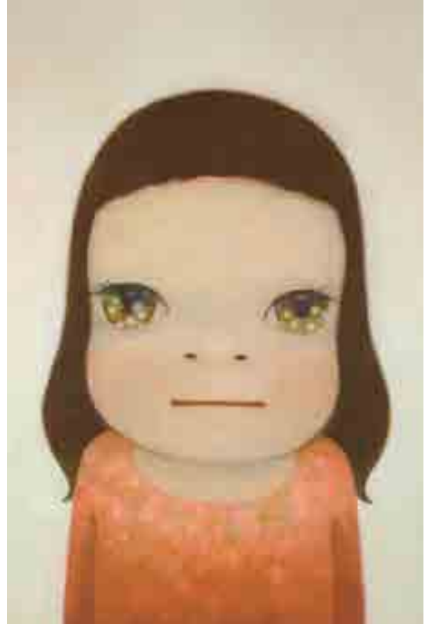
奈良美智 ならよしとも 《コズミック》2007 タグチアートコレクション