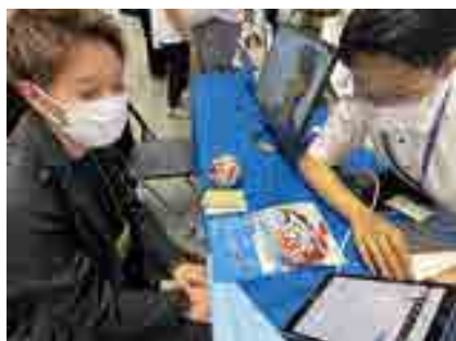
岡山介護サービス博覧会