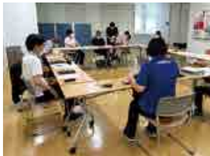
医療介護連携推進協議会の会議

2年目は自分なりの考えを多くの皆さんと共有し、実現していくために「行動」する年にしていきたいです。課題は多くありますが、残り2年間も楽しんで活動していきたいと思えます。