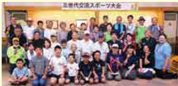
3世代交流スポーツ大会 参加者の皆さん

公民館のそばには伯備線が走っていて、毎日のように全国からカメラを携えた鉄道ファンが訪れる絶好のポイントになっています。 ☎高倉公民館 ☎ 26-0059