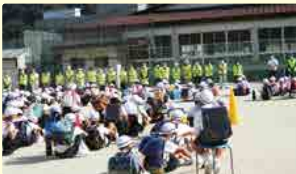
落合小学校での見守り隊の皆さん