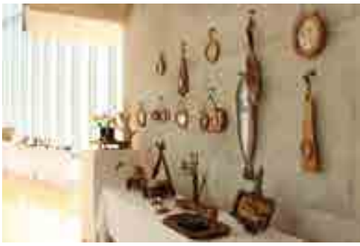
6月に開催された「なりわい工芸品同好会作品展」

※これ以降の「市民ギャラリー」の予定は、美術館ウェブサイト「年間スケジュール」をご覧ください。