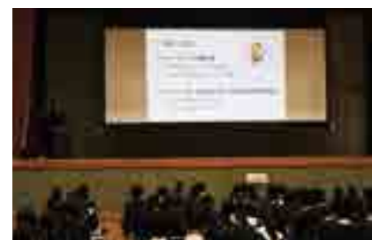
最終報告会の様子