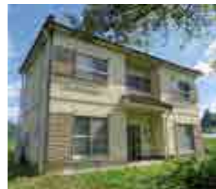
▼備中宇治彩りの山里お試し暮らし住宅 (宇治町宇治)