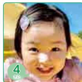
4 さい もりさき れ 森崎 すみ玲ちゃん (中之町)