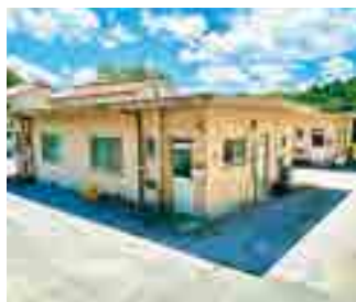
▲天空の里平川お試し暮らし住宅 (備中町平川)