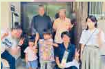
留学体験をしたご家族とNPO 夢風車うかんのメンバー