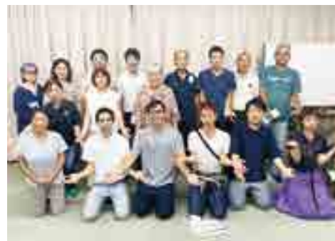
▲吹屋に住んでみんな会の皆さん