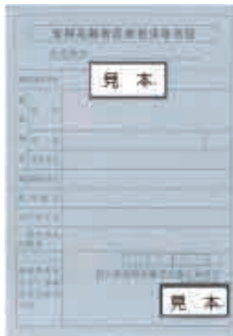
後期高齢者医療被保険者証（水色）

希望される場合は、保険課、各地域局、各地域市民センターに申出書を提出してから、各金融機関で口座振替の手続きを行ってください。