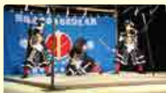
▲子供神楽競演大会の様子

また、成羽地域に伝わる踊りを後世に継承するため、毎月第1日曜日に成羽音頭と成羽小唄の踊りの講習会を実施しています。感染症防止のため披露する機会がありませんでしたが、昨年からは成羽町民スポーツ祭で披露させていただいています。