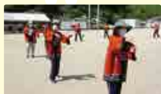
▲町民スポーツ祭の様子

また、成羽地域に伝わる踊りを後世に継承するため、毎月第1日曜日に成羽音頭と成羽小唄の踊りの講習会を実施しています。感染症防止のため披露する機会がありませんでしたが、昨年からは成羽町民スポーツ祭で披露させていただいています。