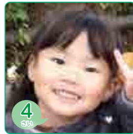
4 さい にたに のどか 仁谷 和花ちゃん (落合町阿部)