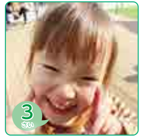
3 さい ひがし さあや 東 沙彩ちゃん (落合町阿部)