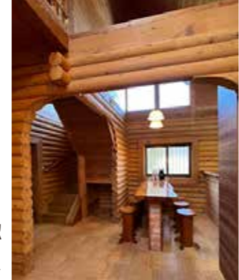
木のぬもり助産院 (令和6年度より追加)

そのような悩みに応えるために、医療機関や助産院の助産師などから母乳ケアや授乳指導・育児相談を受けることができる「産後ママ安心ケア事業」を実施しています。