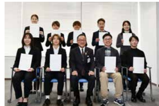
今年度は総勢9名の隊員が活動しています