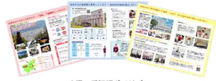
高梁×看護師ガイドブック

市ウェブサイト「高梁2025～地域医療の高梁モデル構築に向けた100の検討とアクション～」にこれまでの議論の内容などを掲載しています。