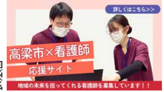
高梁×看護師 応援サイト

また、併せて看護師募集パンフレットのリニューアルを行い、市内医療機関の情報や市内で看護師として働く際に利用できる制度、看護師確保の取り組みなどの紹介も行っています。今後は看護学校や高校への訪問時やイベントなどで配布し、より多くの人に情報を届けていき市内で勤務する看護師の確保に向けて取り組んでいきます。