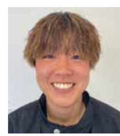
のまらこほろ 隊員

高梁市には、まだ知られていない魅力がたくさんあると感じています。地域の皆さんが住みやすくなるような取り組みや、全国の人に移動してもらえよう取り組みを活動内容であるスポーツ振興と絡めて行いたいと思います。まずは私自身が高梁の魅力を知り、若い力で全国に発信していきたいと思っています。