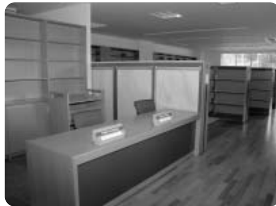
インターネットもできる図書室