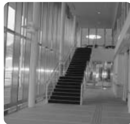
ガラス張りで開放感のある1階ロビー