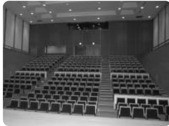
300席を有する多目的ホール