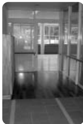
段差のないつくり