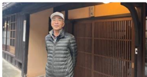
七代目村長が語る「吹屋ふるさと村」～吹屋を愛して生き続ける～