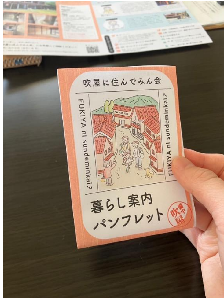
240730_吹屋パンフレット(表)