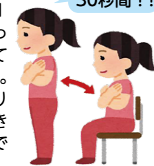
■イス座り立ちテスト(30秒間)