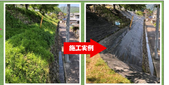
(広告) 広告の内容については広告主へお問い合わせください