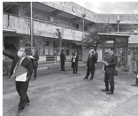
落合小学校の中庭

2月12日に「空き家対策についての現在の状況確認等」「教育施設の現状と対応状況」について所管事務調査を行いました。高梁小学校、落合小学校、成羽小学校の順で現地視察を行った後、施設整備の要望等について、現状と対応についての質疑応答を行いました。それぞれの教育施設はPTAの要望も含めて、安全性・教育効果など