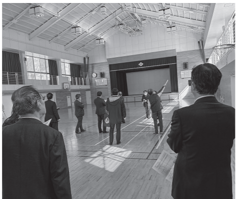
高梁小学校の体育館