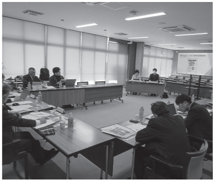
市公式 LINE で議会情報を発信(和歌山県橋本市)