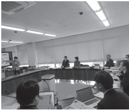
分かりやすいパワーポイントでの説明(奈良県王寺町)

2月4〜5日、市民が読みやすい議会だよりの紙面づくりを目指して、先進自治体である和歌山県橋本市と奈良県王寺町の取り組みを視察しました。橋本市では読者を議会だよりに巻き込む工夫を学び、王寺町では工