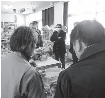
建物内で説明を受ける

2月9日、川上研究開発センター(アグリテクノサーチ株式会社)を視察しました。本センターは高梁市との協定に基づき平成23年に開設され、農業機械の開発や種子のゲル加工技術「タネまる」の研究、果樹の栽培など幅広い取り組みを行い、地域農業の振興に貢献していま