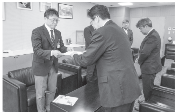
議長から市長へ提言書を提出

その後の検討協議会で、今後の対応をホテルの経営継続と断念の二面から検討しました。具体的には、銀行融資やスポンサー公募による経営継続の方向と、民事再生法の活用や会社清算と売却など経営断念の方向を示し、それぞれの選択による課題も整理した提言書(案)をまとめました。