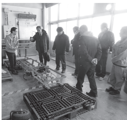
センター内の倉庫の様子

す。また、人材育成や まち 圃場管理など地域への関わりも深く、今後の農業の可能性を感じる有意義な視察となりました。