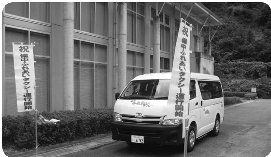
運行が始まった「備中ふれあいタクシー」