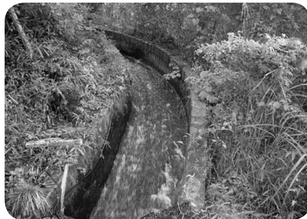
小水力発電の候補地 (吉岡銅山跡湧水)

山跡湧水の候補があるが、本市の方針はどうか。 市民生活部長 現在、県で調査をされており、今後の結果をみながら連携をとり、小水力発電の実効性や導入に向けての研究をする。