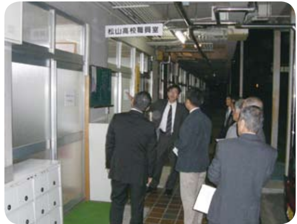
松山高校を視察する委員

総務文教委員会は、10月17日(月)高梁市立宇治高校と松山高校を視察し、市立高校の現状及び課題について学校関係者から説明を受けた後、授業を参観しました。その後、施設内を見学しました。