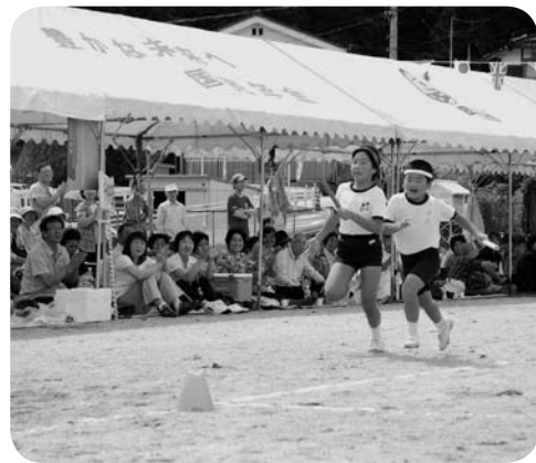
学校は地域住民の心のよりどころ

ない人数である。 市長 1年間の休館によって離れた利用者に来てもらうため、地道な経営努力、宣伝広報活動に一層力を入れる必要がある。 学校統廃合について 内田 教育委員会では学校統廃合について、基本的な手順として、まず保護者と教育委員会が合意をし、その後、地域と教育委員会の合意を得て実施するとしているが、地