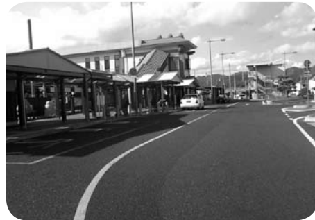
総社駅東口駅前広場

川上 備中高梁駅のバリアフリー化事業の実施主体は、あくまでJRではないのか。財源内訳表では、市を実施主体とした案が出ている。なぜ市が3億円すべて負担しなればいけないのか。実施主体が市で、なぜJRのために駅舎を新たに作る必要はないのか。橋上化は7億円で、JRの負担は1億円、残り6億円は税金だ。国の負担3分の1、JRの負担3分の1、市の負担3