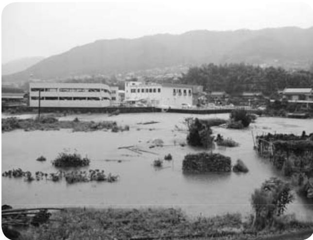
台風12号での河川の増水による水害(落合町阿部地内)