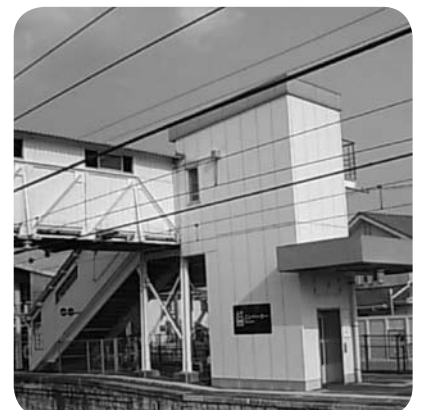
庭瀬駅跨線橋直付けエレベーター

いう意見である。現駅舎を解体しなくても、庭瀬駅や清音駅のように、跨線橋に直付けでエレベーターを設置すればいいのではないかと。市長 備中高梁駅の跨線橋は強度不足でエレベーターの直付けはできない。西側駅前広場は、通