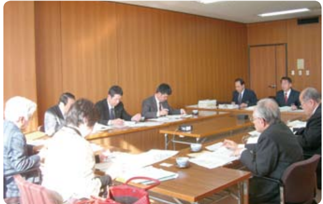
多摩市役所で説明を受ける委員

先般、議会運営委員会が東京都多摩市と茨城県取手市に行き、管外視察を実施しました。 多摩市議会では、決算特別委員会の改革と出前委員会の取り組みについて、取手市議会では、議会映像のインターネット配信とメールマガジンの配信、議会費の縮減の取り組みについて勉強してきました。