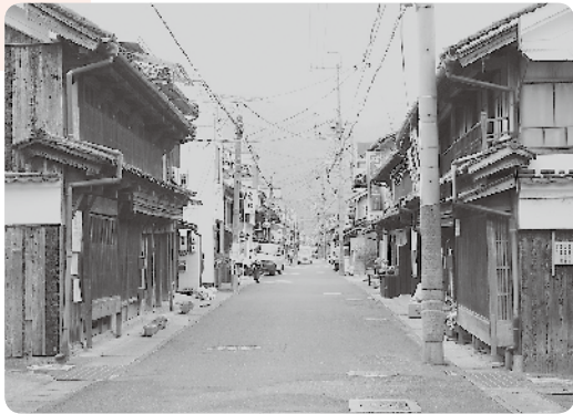
景観モデル地区の本町界隈