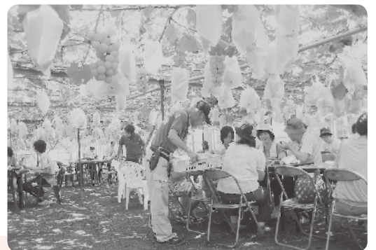
川上モデル農場(川上町世界のぶどう園)