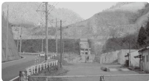
処分場建設予定地