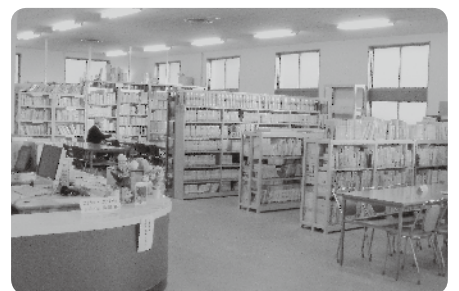
昔と変わらぬ中央図書館カウンターからの眺め