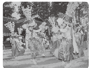
渡り拍子(花笠:鋤崎八幡神社)