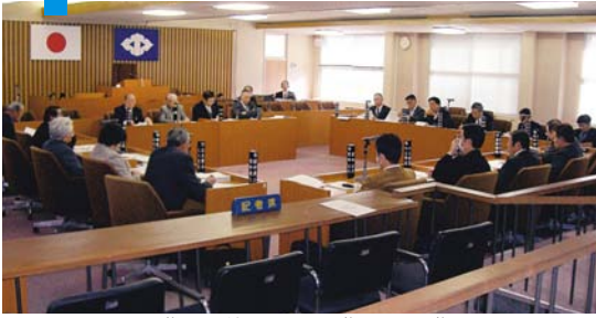
議場を使用しての議員間討議

昨年12月19日に新庁舎建設調査特別委員会の報告があった後、全議員による議員間討議を初めて行いました。新庁舎建設にテーマを絞った討議でしたが、論点整理ができなく進行も乱れる形となりました。現在、策定中の議会基本条例の中では、議員間の議論を活発に行うようになっていきますので、今後も試行錯誤しながら進めていきたいと思っております。