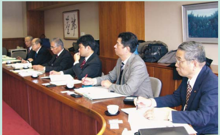
京丹後市議会で説明を受ける委員

去る1月23日、24日にかけて議会改革調査特別委員会が、兵庫県朝来市と京都府京丹後市に行き、行政視察を実施しました。朝来市議会では平成21年4月に議会基本条例を施行、また京丹後市議会では平成19年12月に議会基本条例を施行しており、その取り組みの経緯などについて説明を受けました。どちらの市議会も議会改革度の上位にランクされており、大変参考になりました。