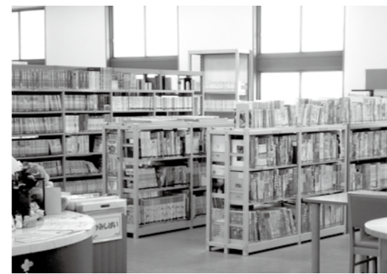
現在の高梁中央図書館2階

中央図書館整備計画では、執行部が示した駅前バスセンターに対して、議員からは、もう一つの候補地であった文化センター南側の市有地に建設すべきだとの意見や、場所の決定に至る経緯説明を求める意見や、建設位置について再考を求める意見などが出されました。