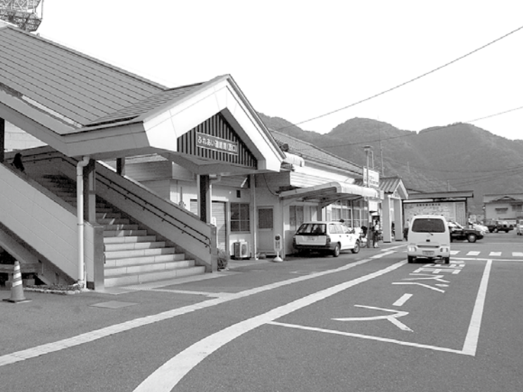
現在の高梁駅前広場

JRが行う備中高梁駅バリアフリー化事業に対する市の負担金が予算化されたものです。このバリアフリー化事業にあわせて、市では駅西交通広場整備が計画されており、今後は、計画の詳細が議会へ示されますので、全員協議会等で議論することになります。