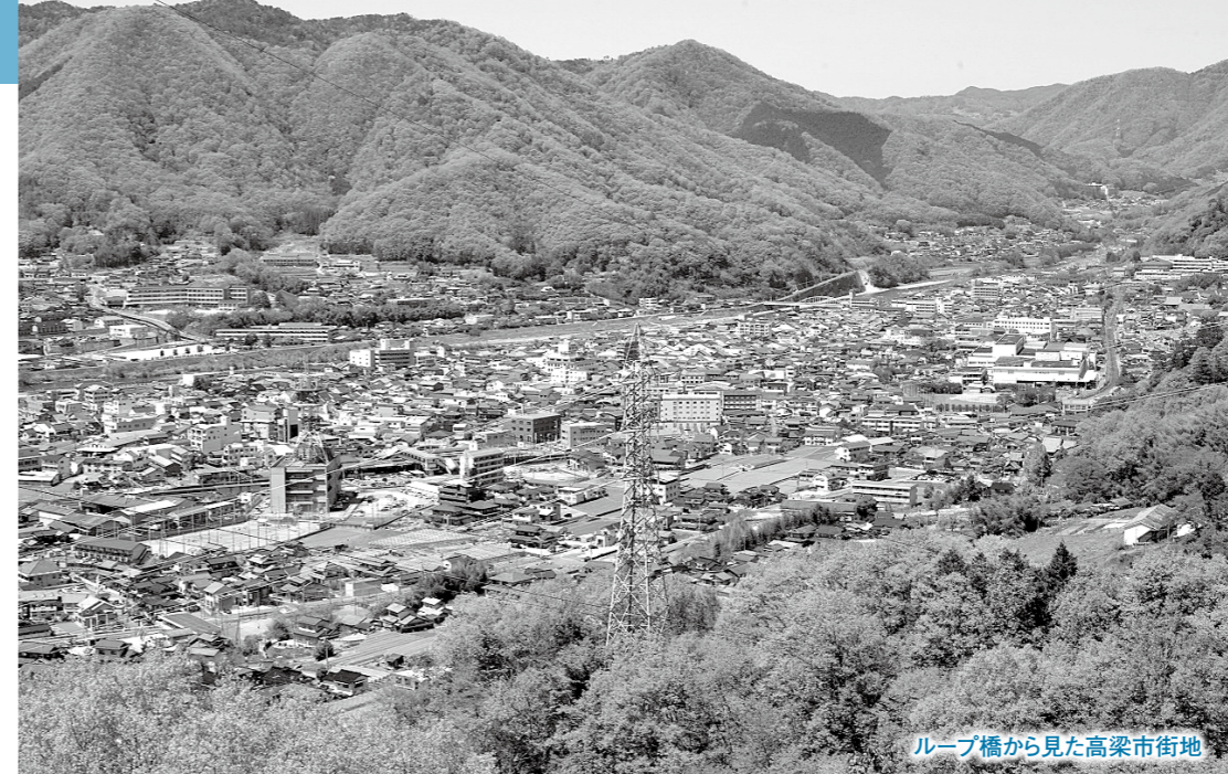
ループ橋から見た高梁市街地

市長から、定住対策・子育て支援の充実に引き続き取り組みほか、教育環境の整備、産業振興、健康・福祉・環境対策、交流人口の増加を柱にした、平成25年度予算が提案されました。