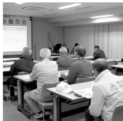
高梁会場(高梁市文化交流館)の様子