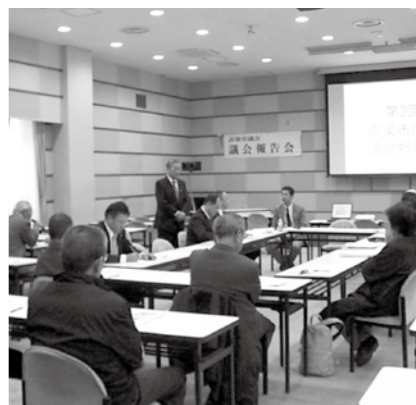
高梁会場(高梁総合文化会館)の様子