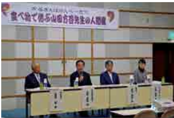
食や酒についてのエピソードを紹介