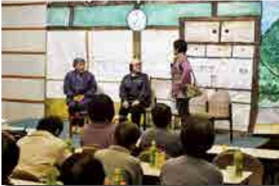
ユーモアたっぷりの寸劇

「高梁市婦人大会」(市教委、市婦人協議会主催)が開かれ、約120人が参加。子育てについての講演会や悪徳商法を防ぐ寸劇が行われました。