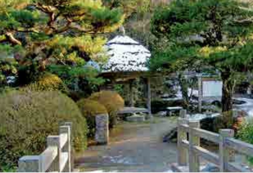
方谷園(中井町西方)