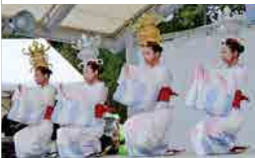
風ぐるまフェスタで「山鹿灯籠踊り」を披露 (平成23年11月13日)