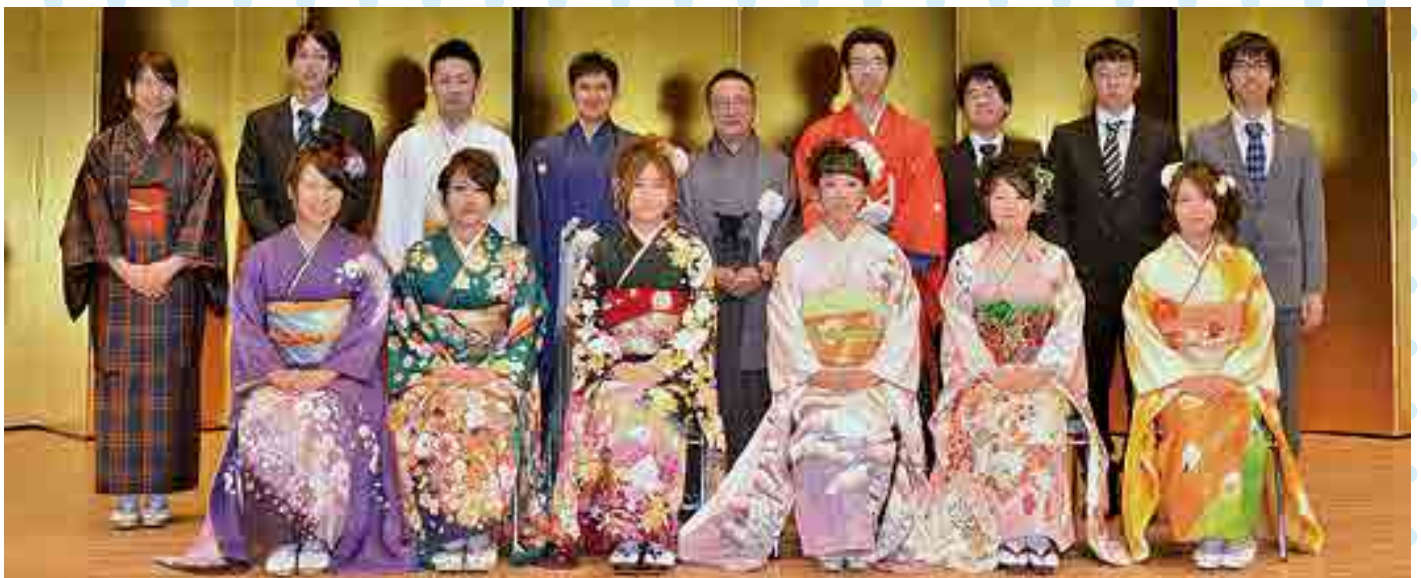
▲ 平成26年高梁市成人祝賀式実行委員会の皆さん