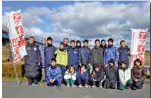
高梁市選抜チームの皆さん

ジュニアの発掘や育成を狙いに、県内各市町村が対抗形式で競う「第3回晴れの国岡山駅伝」(岡山陸上競技協会主催)が開催されました。