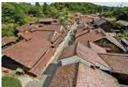
吹屋の町並みと山並み