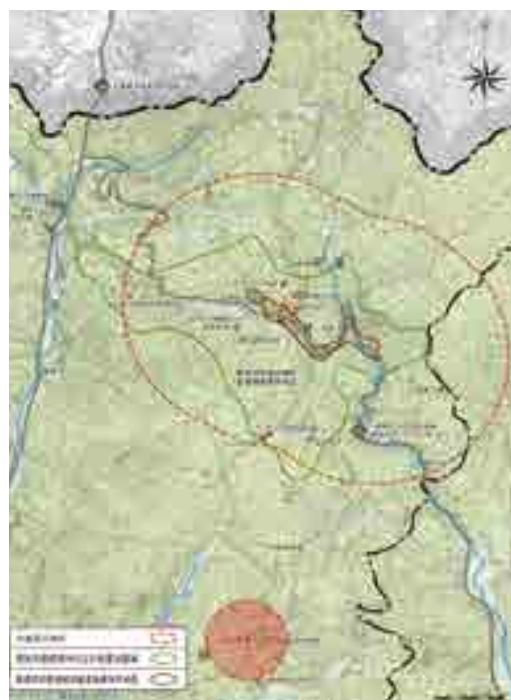
吹屋周辺地区の範囲図