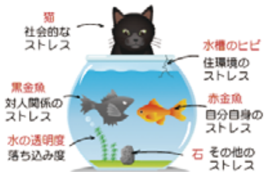
本人モード 結果画面（例）