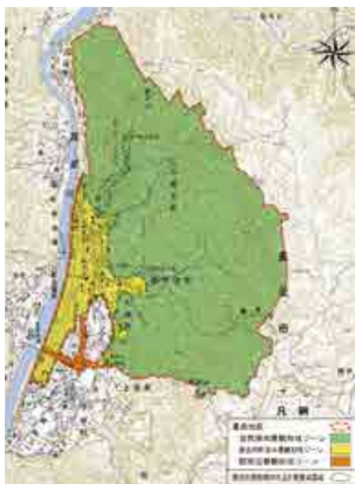
高梁城下町地区の範囲とゾーン区分図