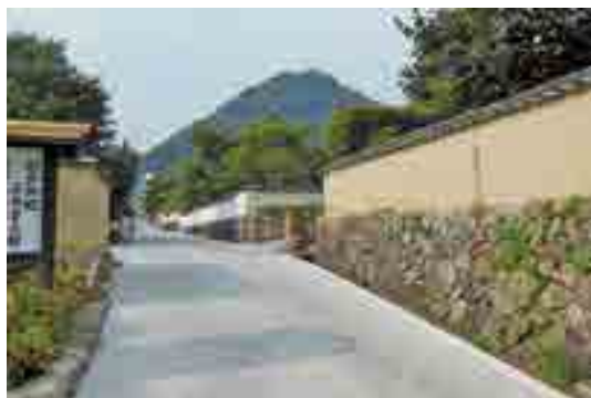
武家屋敷通りから見た臥牛山

・備中高梁駅の東側の新たなまちなか生活エリアとして、愛宕山や松連寺の眺望を活かした潤いとゆとりのある町並み景観の形成を目指します。