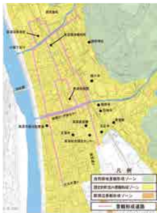
景観形成道路位置図