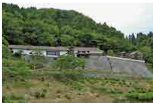
広兼邸と背景の森林