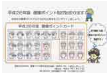
たかはし健康ポイントカード