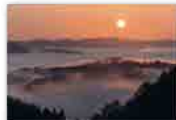
「雲海の波のはざまに うつる城影」