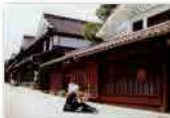
「吹屋の町並みのんびりスケッチまあいいか？」