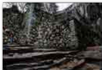
「石垣に歴史を刻む 山城の面影」