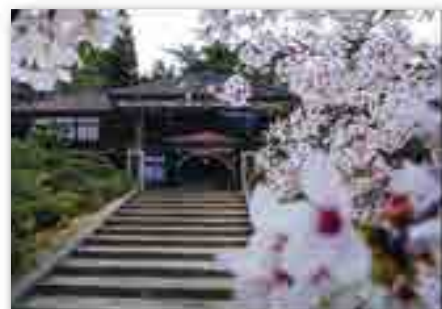
「サクラの花と共に 生きてきた111年！」