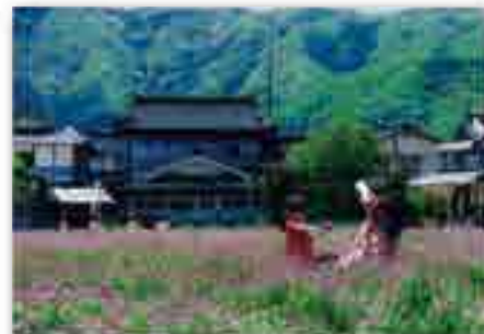
「小さいころから見ていた このまちを忘れない」