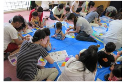
七夕飾りを親子でなかよく作 りました。