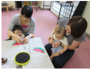
すいかのたねはスタンプで ペタペタしました。