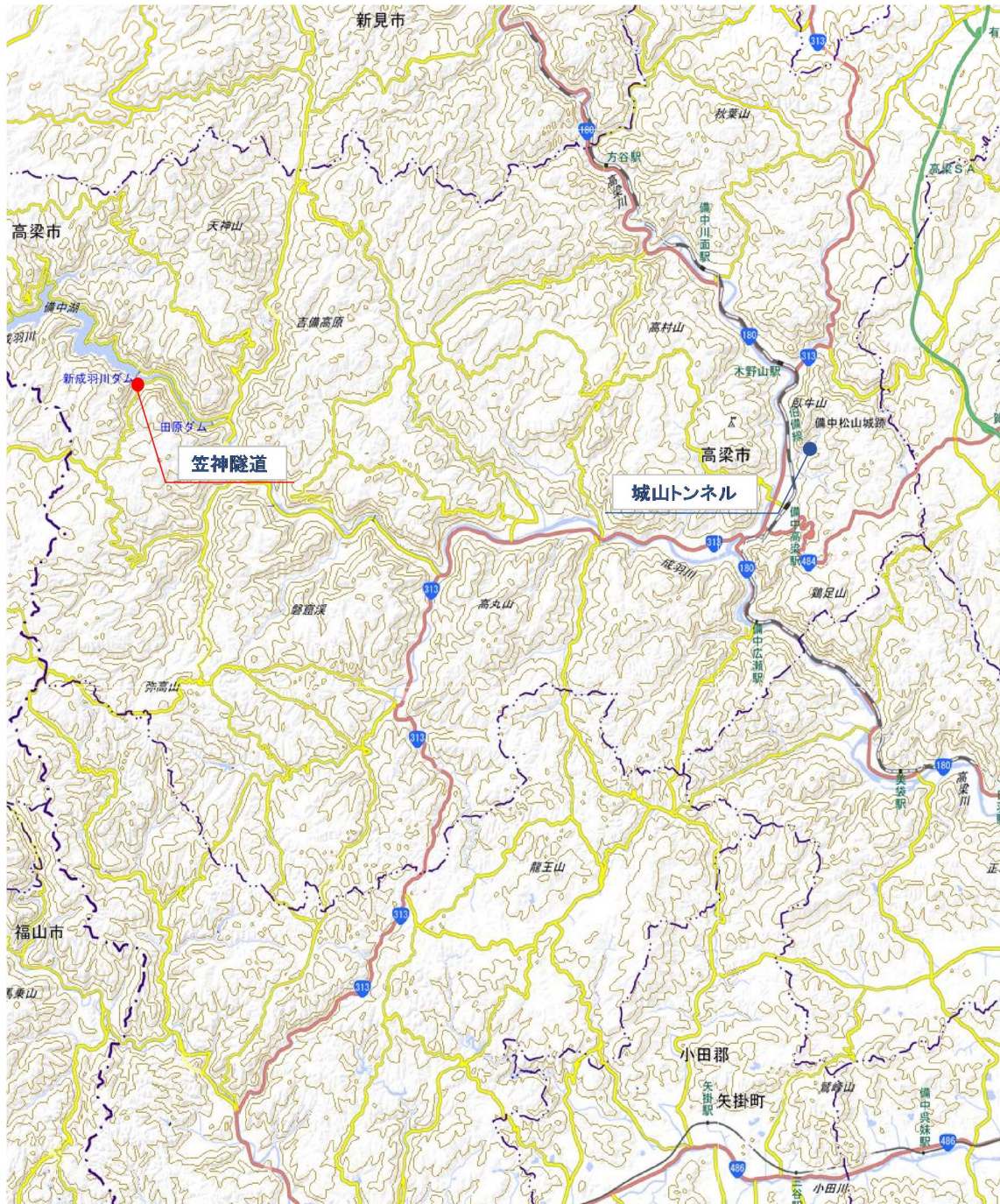
高梁市トンネル位置図