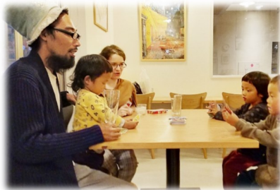
H30・R1採択事業 (フォレストフォーチルドレン)

NPO関係者、町内会、市民活動団体など、「市民活動」に携わる様々な人が集まって、日ごろの悩みや思いを語り合いましょう。知り合いをたくさん作ってネットワークを広げたい方、これからの活動のヒントをもらいたい方、市民提案型まちづくり支援事業に興味がある方…ぜひご参加ください！