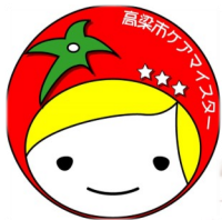
H29・30採択事業 (NPO法人 岡山県介護支援 専門員協会 高梁支部)