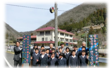
H30採択事業 (福地をよくする会)