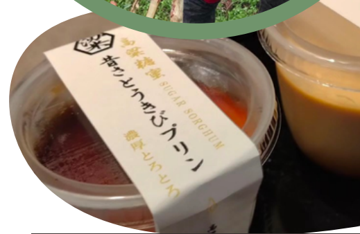
昔さとうきびプリンは絶品！