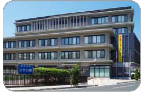
高梁市役所 本庁舎

備中松山城は天守の現存する城としては唯一の山城（標高約 430 m）です。「天空の山城」としても有名で9月下旬から4月上旬にかけては雲海に包まれる幻想的な姿を見ることができます。また、現在備中松山城には城主様が鎮座しておられます。それが猫城主さんじゅーろーです。平成30年7月豪雨災害後から城に住み着いた猫で、被災し激減していた入城者数をV字回復させた立役者です。ぜひ一度会いに来てみてください。