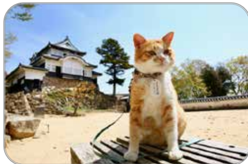
備中松山城 猫城主さんじゅーろー