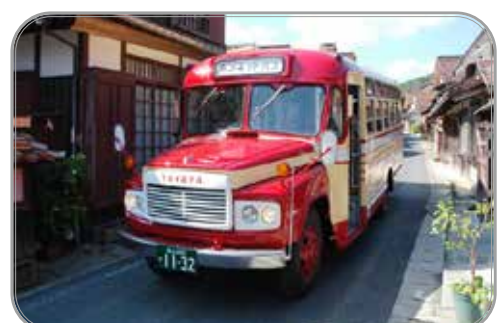
吹屋の町並みとレトロなボンネットバス